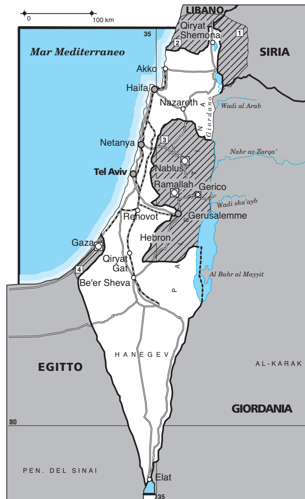
OCCUPATI DA ISRAELE 1 Siria - Aalture del Golan - occupate nel 1967 2 Sud del Libano - occupato nel 1983 3 Cisgiordania - occupata nel 1967 4 Striscia di Gaza - occupata nel 1967 5 Restituiti alla Palestina dal 1994: Striscia di Gaza, Gerico, Nablus, Ramallah

5 Alla fine del secondo conflitto mondiale le colonie francesi della Siria e del Libano e quelle britanniche dell'Iraq e della Transgiordania avevano ottenuto l'indipendenza, mentre la Palestina restava ancora sotto il dominio britannico a causa dell'impegno contratto con la Dichiarazione Balfour. Le milizie ebraiche aumentarono; la più grande e